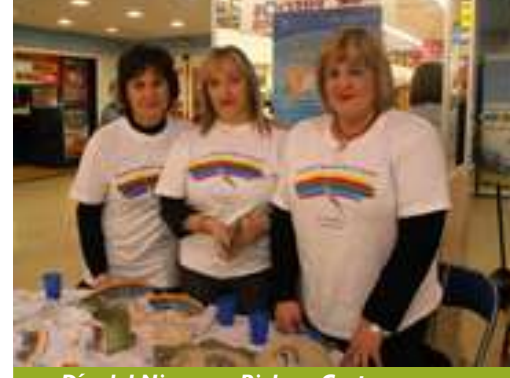
Día del Niemann Pick en Cartagena