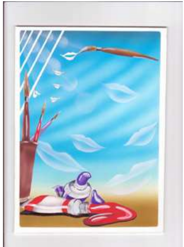
Ilustración: Javier Meléndez.

Nuestros niños nos dan día a día pinceladas de amor, de fuerza, de lucha, de esperanza, pero hay veces que no podemos contener la realidad. Realidad que se ve trucada por esta enfermedad que nos destruye todo con una malicia voraz sin darnos ninguna tregua, así