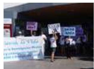
Apoyo sin condiciones para una causa de justicia...!!