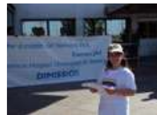
Nos descubrimos ante el ejemplo, la solidaridad no tiene edad...!