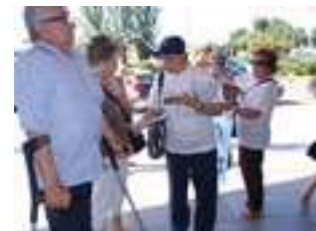
Socios y colaboradores unidos en pro de la divulgación de un derecho...!